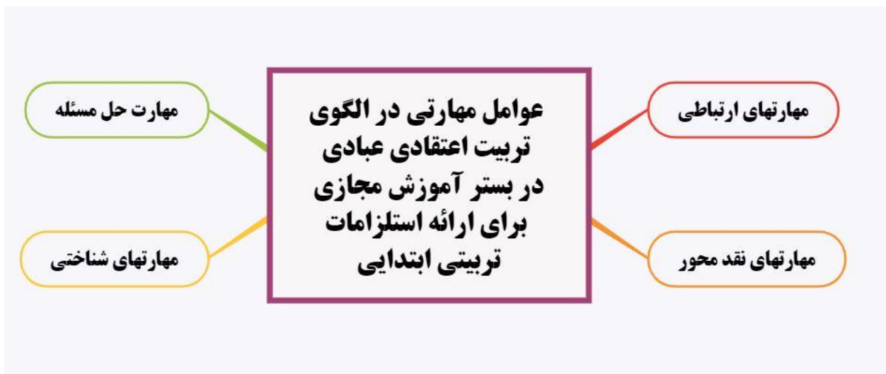
شکل ۱. الگوی نهایی پژوهش

همچنین، در دیگر حوزه‌ها مانند مهارت‌های نقدمحور، حل مسئله و شناختی، نظرات خبرگان به‌طور کلی به‌شدت مثبت و موافق بود و بیشتر مفاهیم مرتبط با این دسته‌ها از روایی بالایی برخوردارند. به‌عنوان مثال، مفهوم «ارزیابی و نقد آموزه‌های دینی توسط متریبان» و «حل مسائل زندگی» در حوزه مهارت حل مسئله، هرکدام دارای امتیاز CVR بالا و درصد بالای موافقت بودند که نشان‌دهنده تأکید و ضرورت این مفاهیم در الگوی تربیت اعتقادی عبادی در بستر آموزش مجازی برای دوره ابتدایی است.